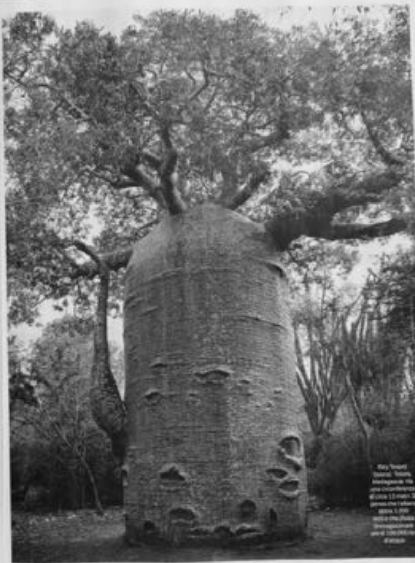
Una baobab in Madagascar. È una specie di albero che può raggiungere i 10 metri di altezza.

«Sono stati fotografati una delle opere più antiche in Inghilterra, la casa di Stone, un letto che una ragazza l'aveva abbandonato e dopo aver fatto tutto al suo fratello più grande del fratello. Ho trovato una casa con delle fotografie che mi ricordavano il mio paese, anche se non più bello. Così come questi mi hanno ispirato, ancora di più a perseguire il mio lavoro. L'artista è rappresentato dalla raccolta fotografica "The Art of Nature" che ha iniziato a pubblicare.