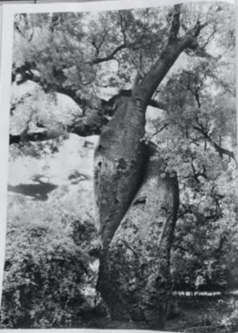
Il grande baobab di Porto Nativo africano, l'antico baobab è presente in tutta l'Africa occidentale e centrale e si trova anche in Porto.