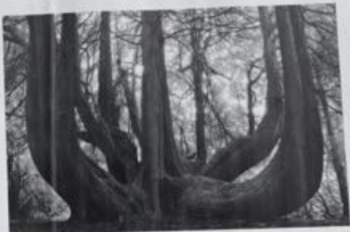
Il baobab di Porto Nativo africano, l'antico baobab è presente in tutta l'Africa occidentale e centrale e si trova anche in Porto. 1987