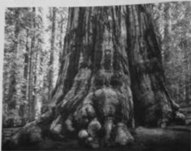
Il tronco di un albero di sequoia gigante, in California. La sequoia è l'albero più alto del mondo, può raggiungere i 100 metri di altezza. In California si trova il Sequoia National Park, dove si trova il più alto albero del mondo, il Sequoia gigante, che può raggiungere i 100 metri di altezza.