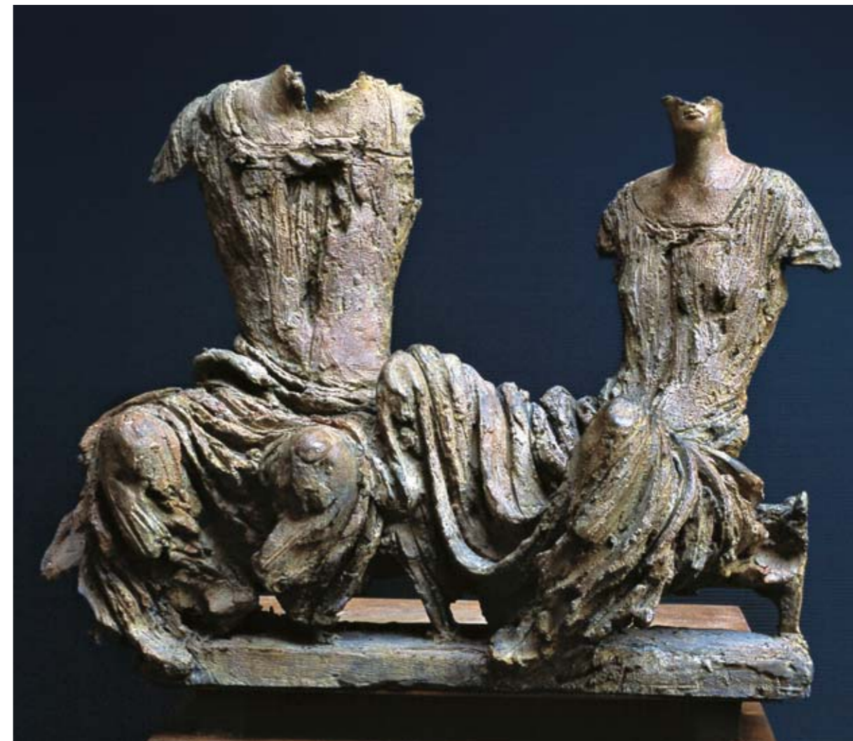
8. IMPERTURBABILI DEI