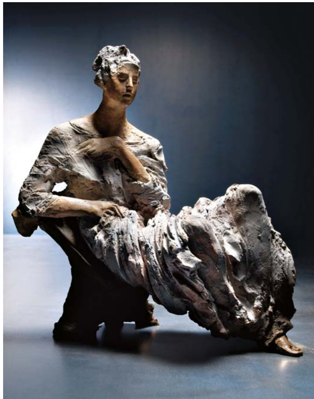
7. MADONNA DELL'ANNUNCIO