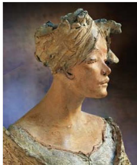
10. IO SONO QUI