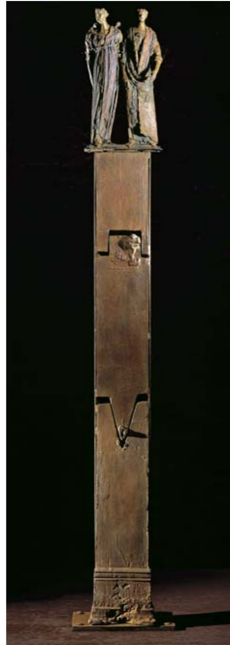
17. CON IL TUO AIUTO