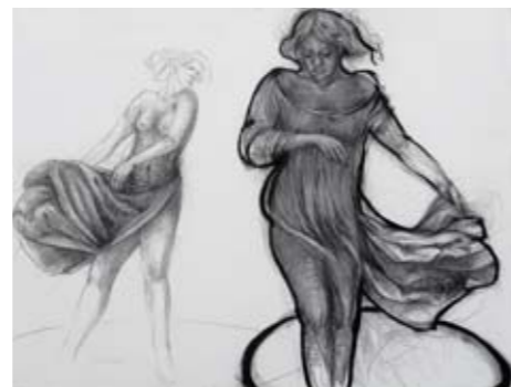
9. I MIEI GIORNI