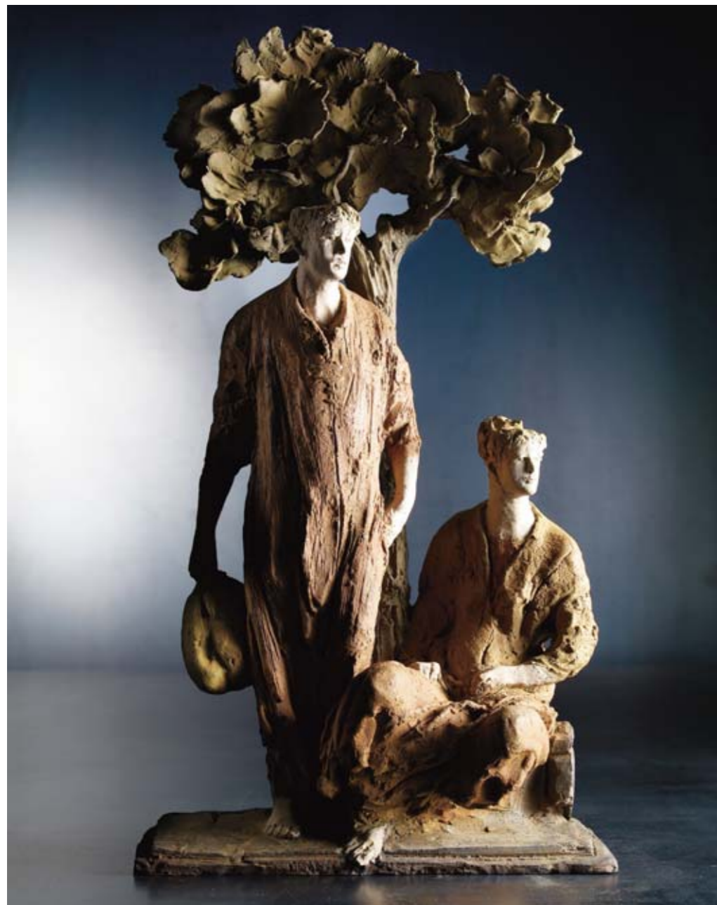
3. IN VIAGGIO