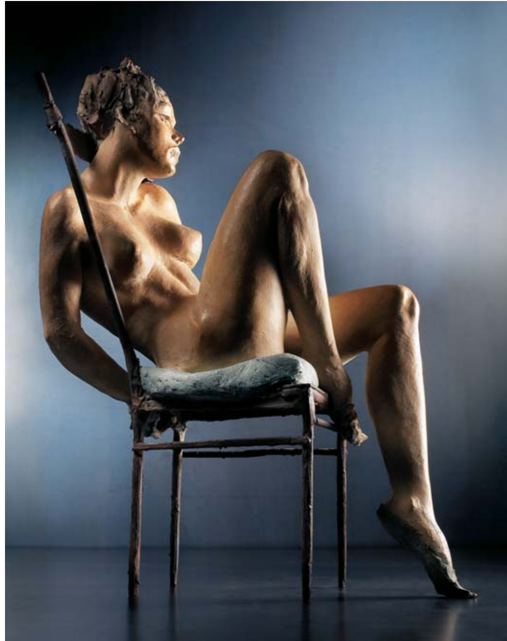
4. LA NUDA VERITÀ