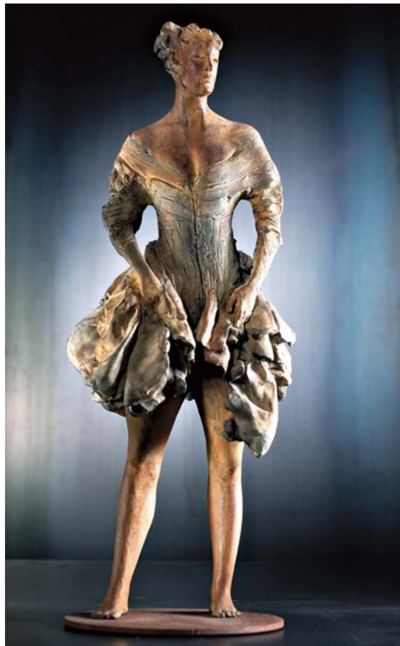
13. LA SFIDA