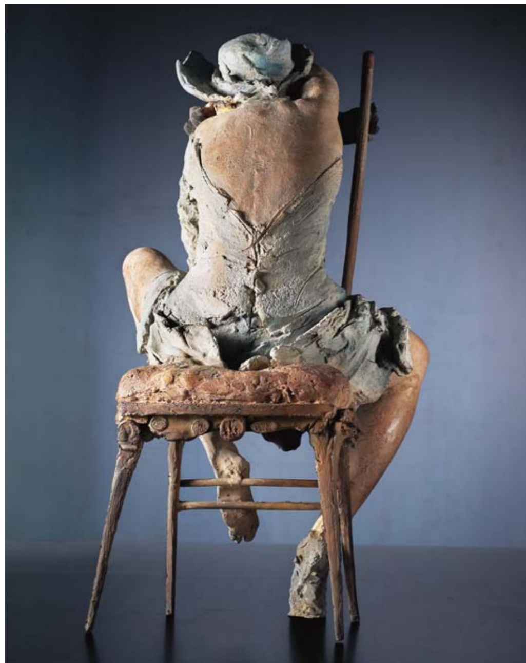
1. LA DONNA DI ARTURO