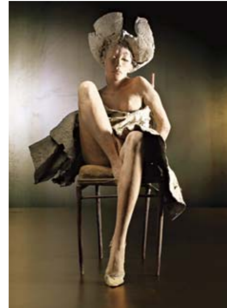
6. LA VERITÀ MASCHERATA