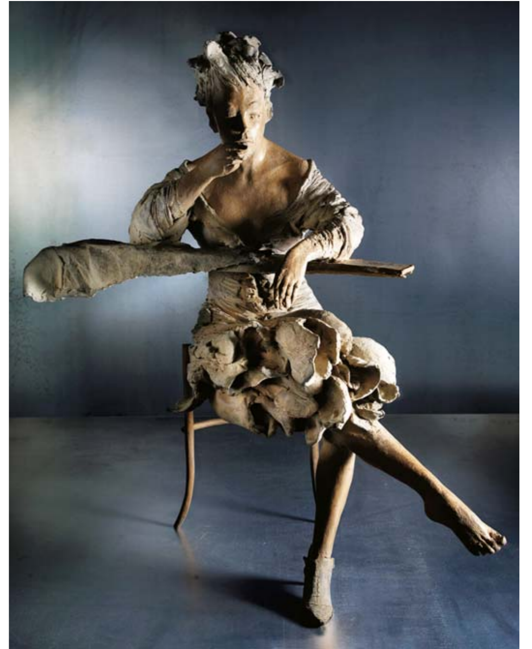
12. CHE FARE?