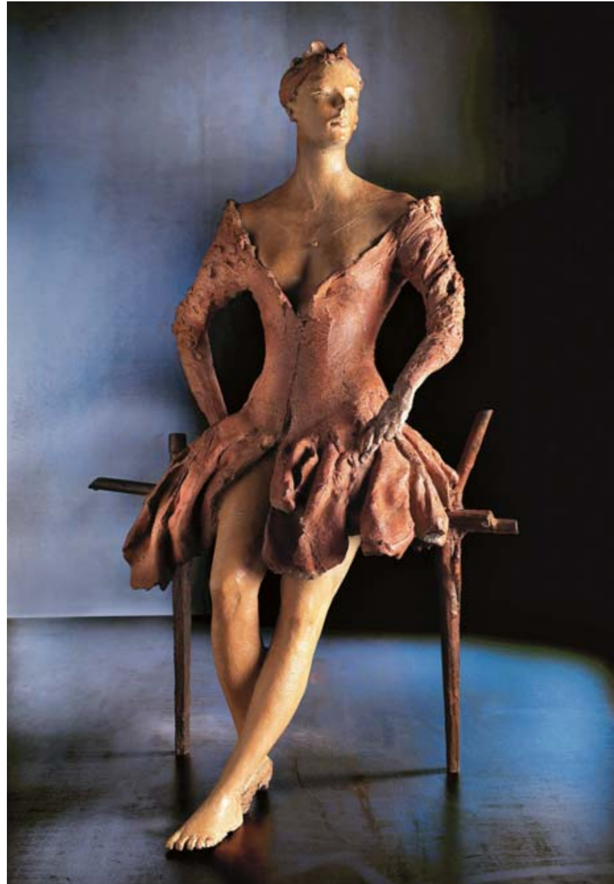
11. PARIS '05